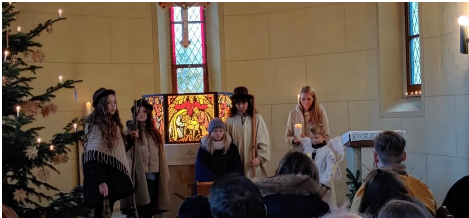
24.12. in der St. Thomaskirche zu Pechau. Die Szene in der die Hirten in den Stall kommen.