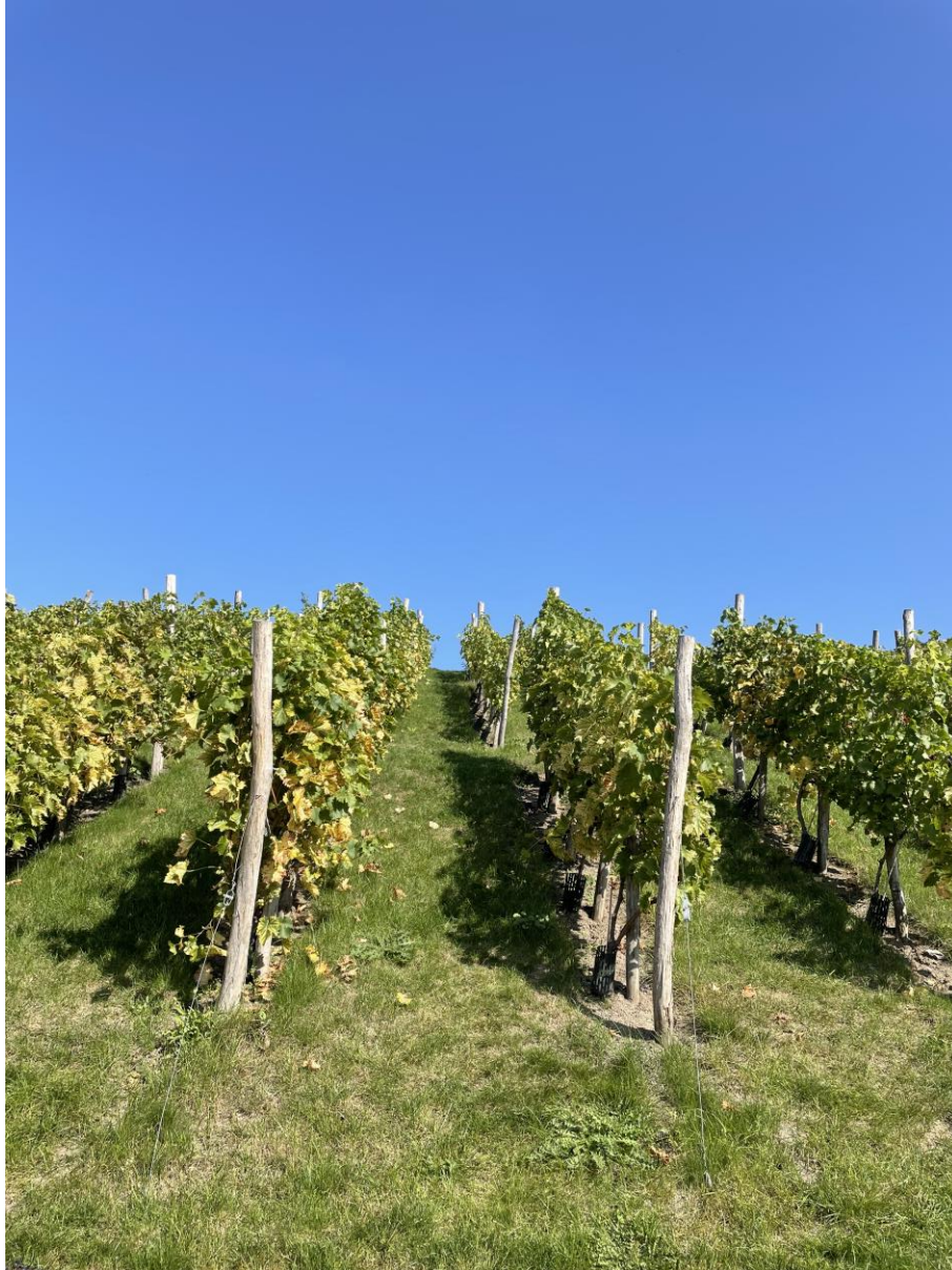
Weinberg in Burg